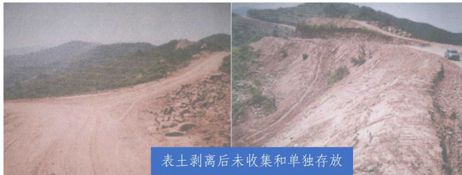
表土剥离后未收集和单独存放

【查处情况】 该公司违反了《中华人民共和国土壤污染防治法》第三十三条第一款“国家加强对土壤资源的保护和合理利用。对开发建设过程中剥离的表土，应当单独收集和存放，符合条件的应当优先用于土地复垦、土壤改良、造地和绿化等”的规定。长治市生态环境局长子分局依据《中华人民共和国土壤污染防治法》第九十一条第（一）项，对该公司处罚款30万元，并对2位相关责任人各处罚款1万元。