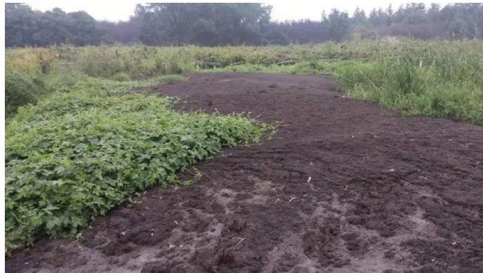
（本图为其它案件图片）

【查处情况】 该行为违反了《中华人民共和国土壤污染防治法》第二十八条第一款的规定，依据《中华人民共和国土壤污染防治法》第八十七条的规定，对该单位处罚款22.5万元。